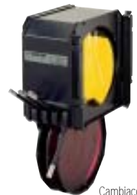
Cambiacolori Colour changer